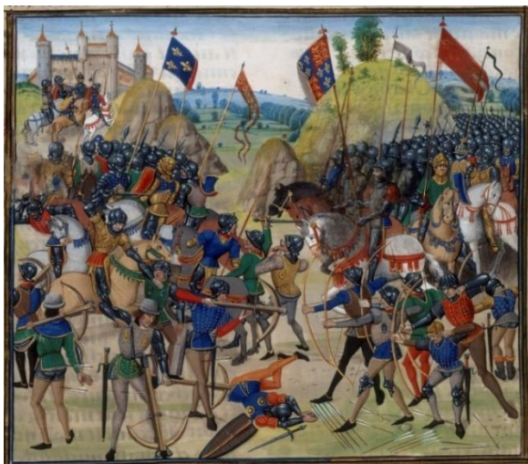
La bataille de Crécy, 1346